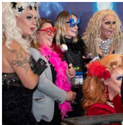
Un groupe d'étonnantes et colorées drag queens a grandement diverti et amusé les quelque 600 invités lors du cocktail et du banquet.