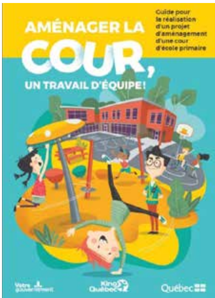
Couverture du guide Aménager la cour, un travail d'équipe en format PDF, disponible en ligne.

des enfants d'aujourd'hui, qu'il s'agisse des structures de jeu, de l'éducation à l'environnement ou de la place qu'on y accorde à la nature. On a notamment pris conscience de l'importance de diversifier les aménagements pour mieux répondre aux besoins des enfants.