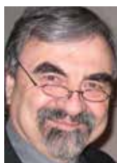
PAR ANDRÉ THIBAUT, Ph. D., PROFESSEUR ÉMÉRITE, UQTR