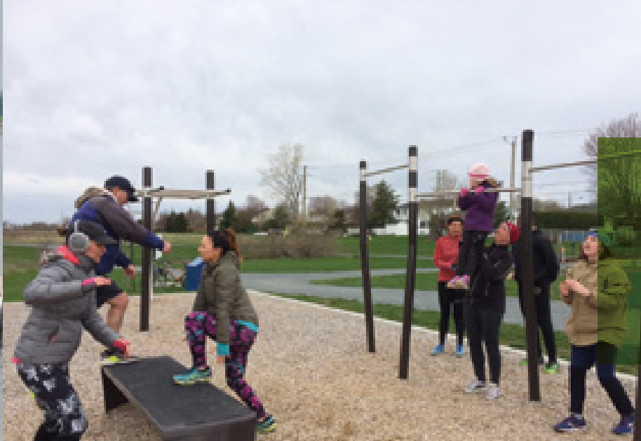
Des citoyens ont décidé de relever le défi santé Trekfit au parc Saint-Charles.