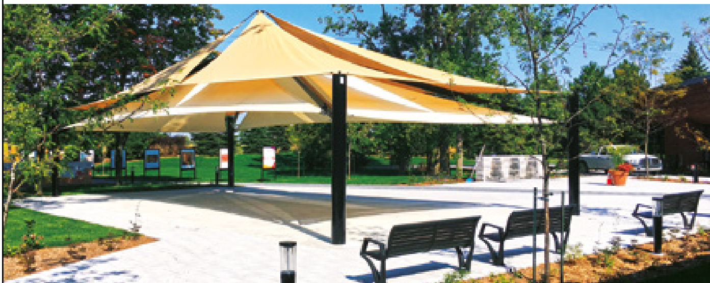
ABRI SOLAIRE – LAPRAIRIE, PLACE DU 350°

Aucun parc multigénérationnel n'est complet... sans un abri solaire TECHSPORT.