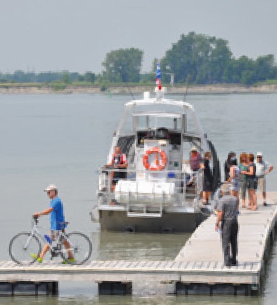
Les citoyens ont le loisir de faire l'expérience des navettes fluviales le temps d'une agréable ballade sur le fleuve Saint-Laurent.