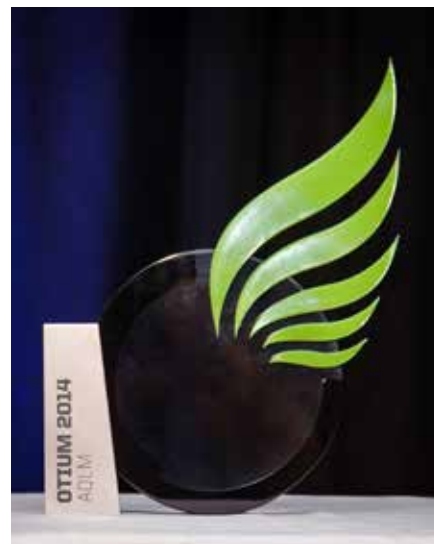
Le trophée Otium a fait son apparition en 2014 comme récompense accompagnant les prix Excellence.

Enfin, en 2014, l'AQLM instituait la catégorie des Grands Bâisseurs. Cette même année, elle créait le trophée Otium, qui allait dorénavant être remis à chaque lauréat ou lauréate.