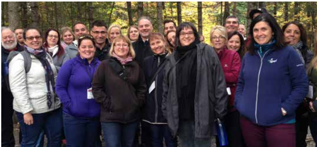
La visite des installations de la base de plein air Les Marais du Nord a bien plu à ceux et celles qui avaient choisi l'atelier terrain « Je suis plein air ».

« En conférence d'ouverture, le maire Labeaume a rappelé que son rôle de maire consistait à "générer du bonheur". Ne devrait-ce pas être le mot d'ordre de tous les professionnels en loisir? »