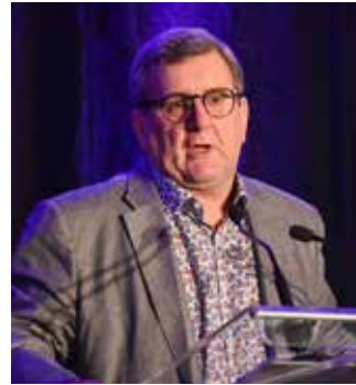
En conférence d'ouverture, le maire Labeaume a rappelé que son rôle de maire consistait à « générer du bonheur ». Ne devrait-ce pas être le mot d'ordre de tous les professionnels en loisir?