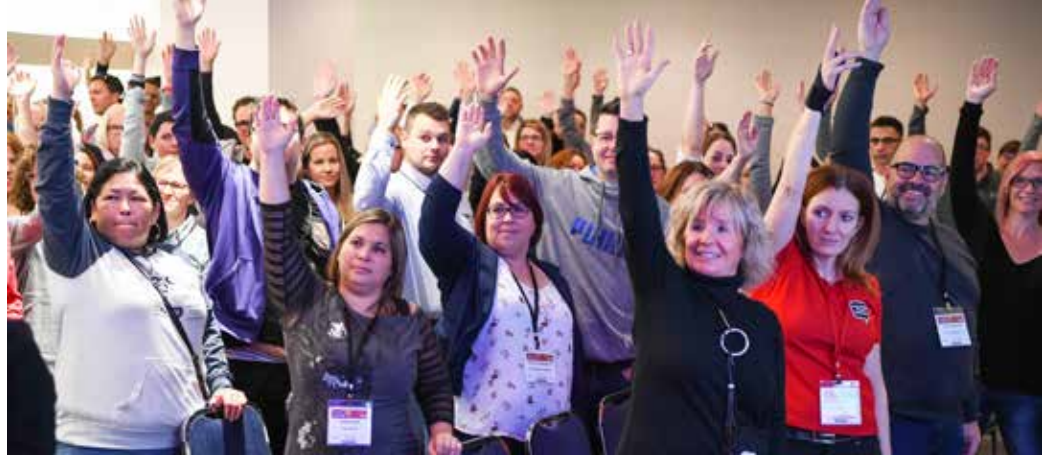
C'est ce qu'on appelle une belle unanimité!