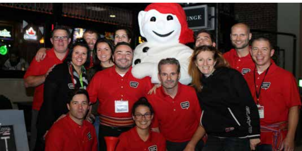
Bonhomme Carnaval s'est invité dans les réjouissances! Coudon, c'est pas en février le Carnaval?