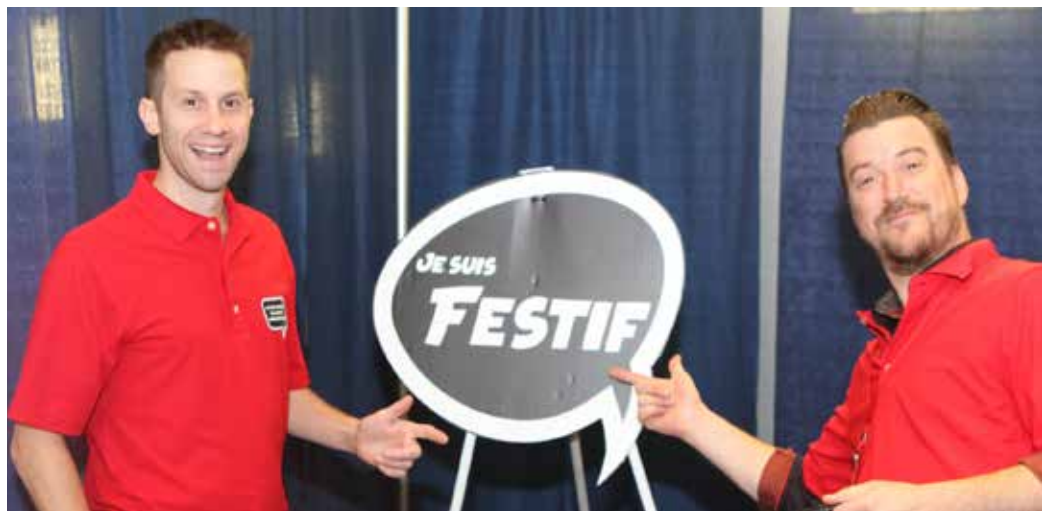
Le message est clair...