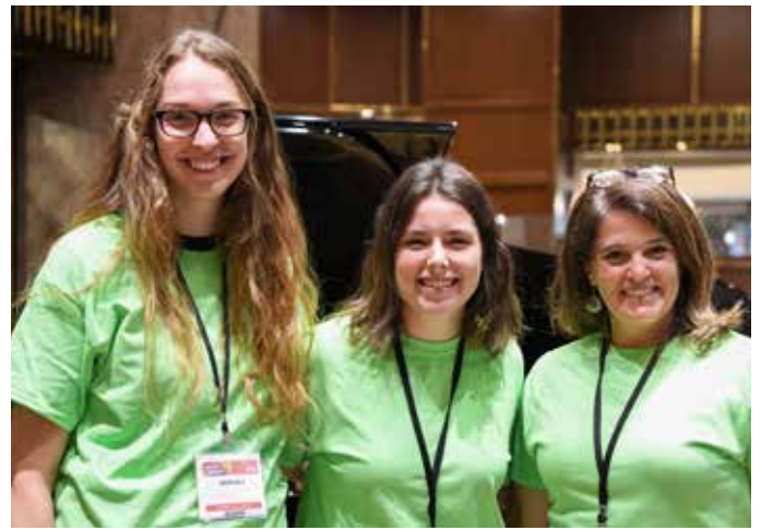
Des jeunes bénévoles enthousiastes, attentives et très heureuses d'être là!