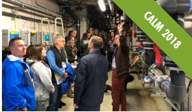
Quelques délégués ont pu visiter le Centre des sports de la base Valcartier dans le cadre des ateliers terrain du 3 octobre.