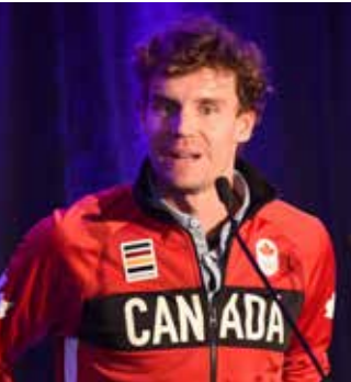
Le marcheur olympique Mathieu Bilodeau a parlé aux délégués de « rêve, détermination et persévérance ».