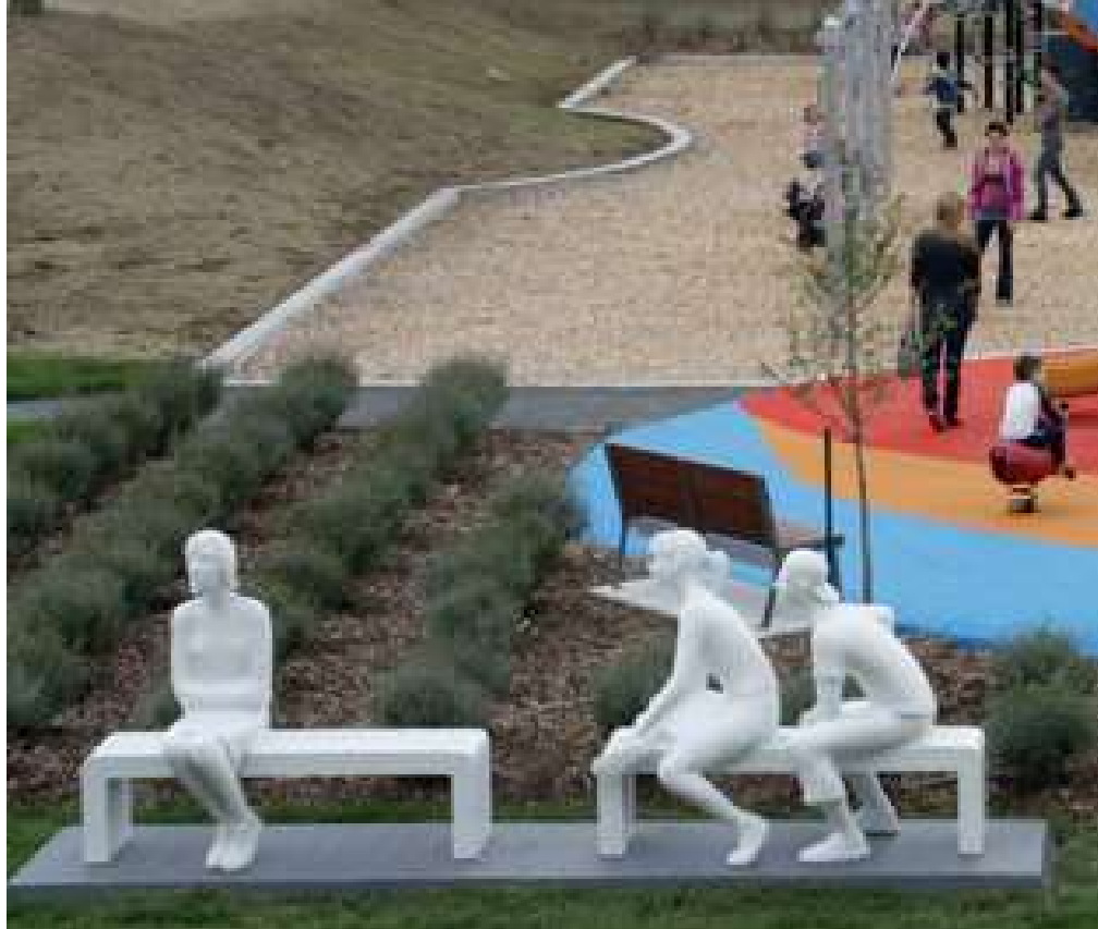
Au parc Claude Henri-Grignon, à Sainte-Adèle, on a intégré une œuvre d'art et organisé un jeu de chasse au trésor qui évoque des personnages historiques de la région.

Les parcs peuvent être des lieux qui favorisent le développement de la culture et l'expression culturelle. La fiche Loisir culturel et parcs 8 aborde l'animation culturelle dans les parcs, les installations et équipements culturels, ainsi que la stimulation de la vie culturelle par divers moyens comme les événements, les expositions, la diffusion de musique et la pratique libre des arts.