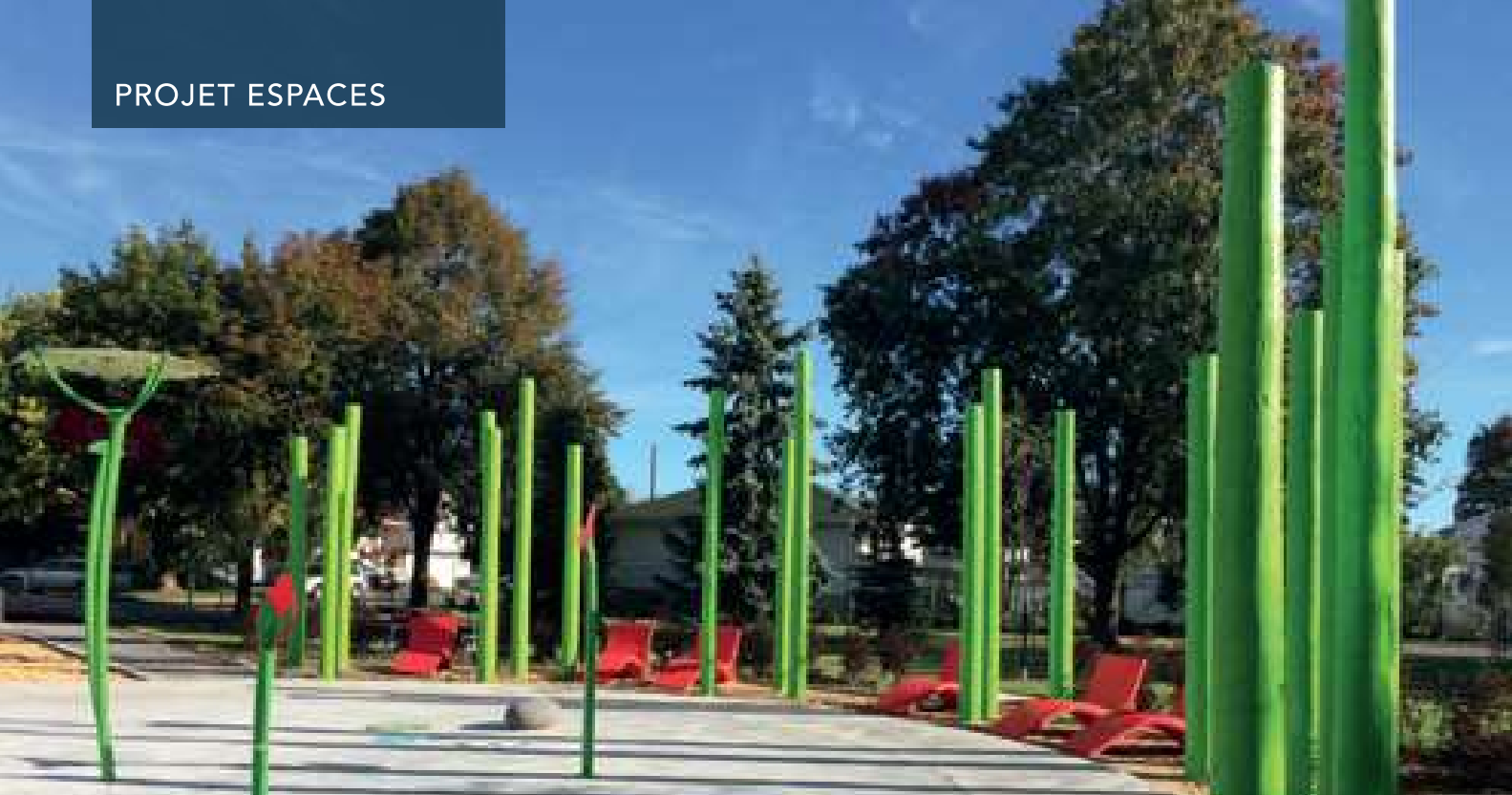
Au parc James Derby, à Brossard, des chaises longues permettent aux parents de surveiller confortablement leurs enfants qui s'activent dans les jeux d'eau.