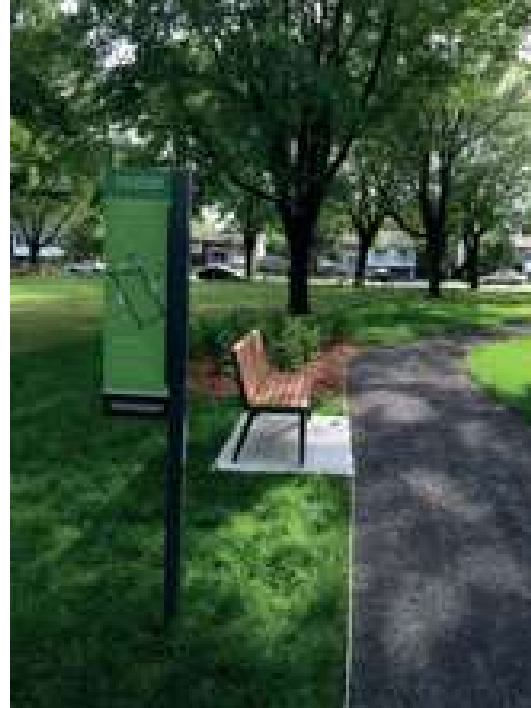
Légende : Au parc Bernini, à Brossard, on retrouve le long d'un sentier un banc et des panneaux d'instructions pour l'entraînement. Les équipements sont multifonctionnels et intergénérationnels.

« Parmi tous les aménagements que l'on retrouve dans un parc, y lit-on, le sentier est sans contredit le plus polyvalent et le plus avantageux, servant tout autant à des fins de passage qu'à des pratiques de loisir. C'est un incontournable dans le parc. Cet aménagement est un moyen efficace de promotion de la santé, car il favorise l'activité physique et les déplacements actifs. Il ajoute aussi une valeur ludique et éducative importante aux espaces publics, offrant souvent un contact particulier avec la nature.