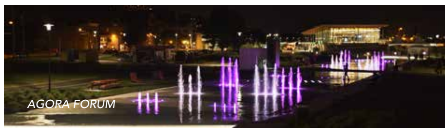
Spectacle Son et Lumière de la Fontaine (au Quai Paquet)

L'actualisation de cette vision s'articulera autour d'un plan d'action qui est actuellement en rédaction. Ce dernier, tout comme la Politique, est élaboré en étroite collaboration avec les partenaires de la communauté et trouve son ancrage dans les besoins exprimés par la population lévisienne.