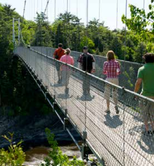
Passerelle du parc des Chutes-de-la-Chaudière