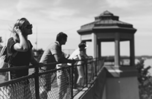
Terrasse du Chevalier-de-Lévis