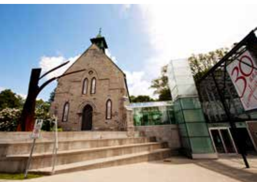
L'Anglicane, salle de spectacle (au Quai Paquet)