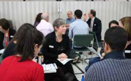
Rencontre avec les citoyennes et citoyens et organismes du milieu dans le cadre des séances de consultation